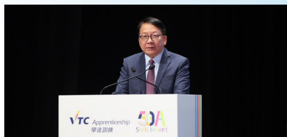
典禮主禮嘉賓政務司司長陳國基先生，GBS，IDSM，JP於典禮上致辭，學徒計劃多年來為香港培育專業技術人才，持續為經濟及社會發展注入動力。

主禮嘉賓政務司司長陳國基先生，GBS，IDSM，JP在致辭時表示，學徒計劃為香港各行各業培育了大量優秀的專業技術人才，為經濟和社會發展持續注入新動力。VTC主席林健鋒先生，大紫荊勳賢，GBS，JP在致辭中亦感謝業界，以及積極支持學徒訓練計劃的企業及僱主，為學徒提供寶貴的學習機會與專業指導，是推動學徒制度薪火相傳的關鍵。