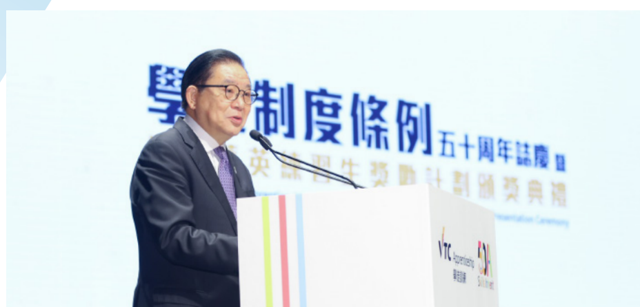
VTC主席林健鋒先生，大紫荊勳賢，GBS，JP於典禮上致辭，感謝業界伙伴及參與學徒訓練計劃的企業及僱主對學徒培育的支持。