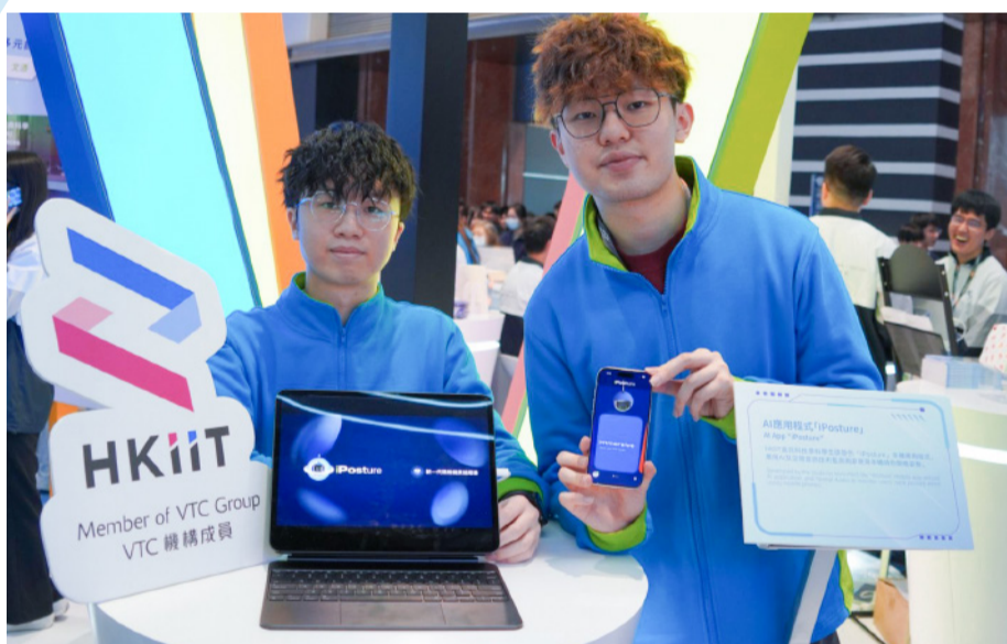
师生团队研发创新项目，体现职专教育的丰硕学习成果。