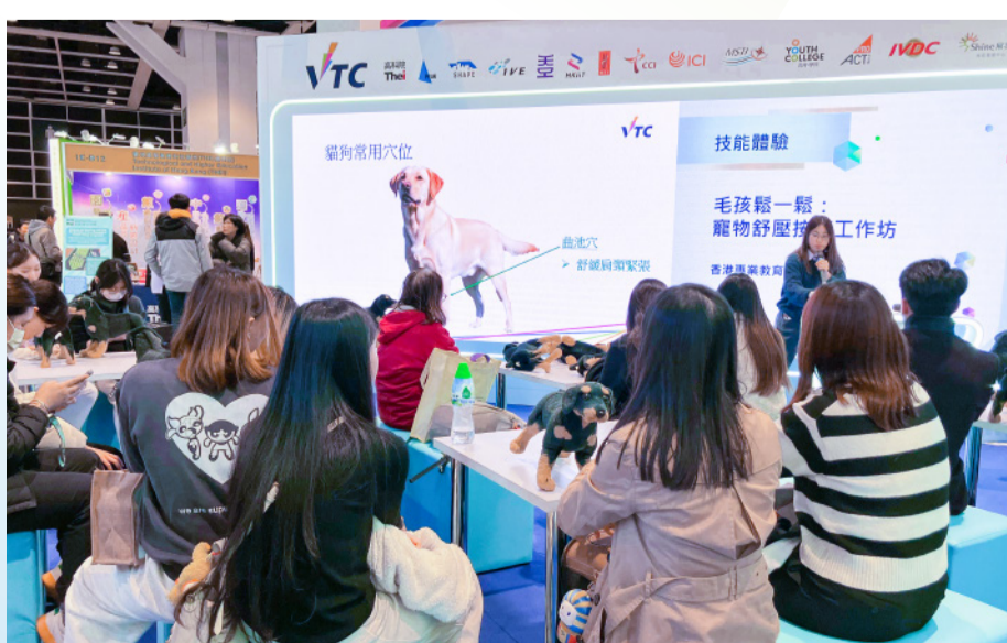
VTC展区亦提供多项技能示范及体验活动，让参加者亲身感受不同专业的实务技巧。