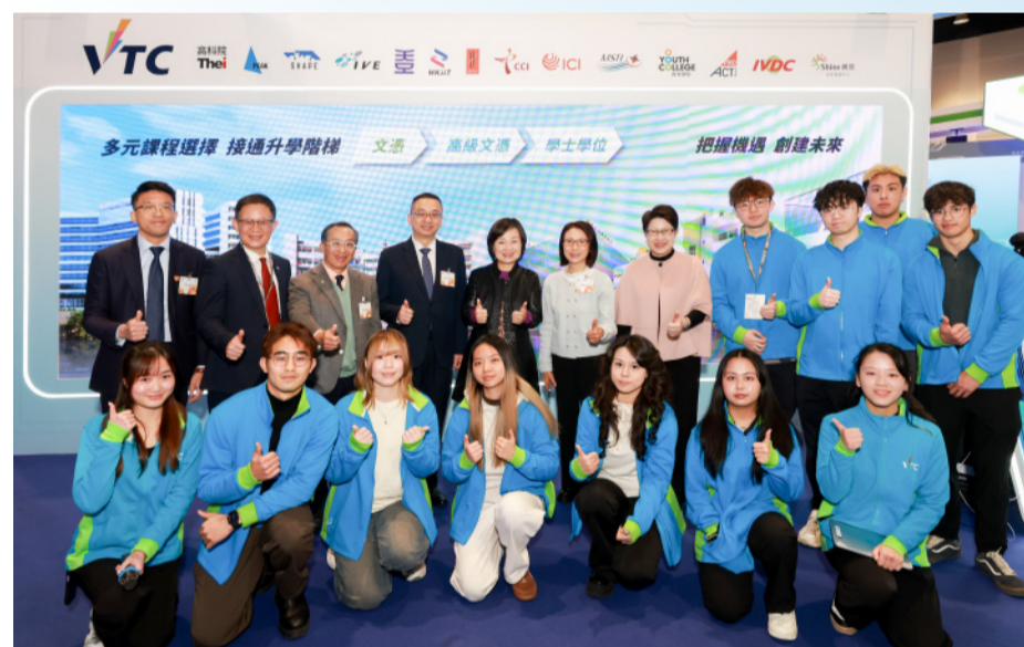
教育局局长蔡若莲博士(后排左五)参观VTC展台，并与VTC学生交流，了解他们将所学付诸实践的成果。

这些项目展示职专教育的多元成果，同时体现VTC「思考与实践」并重教学理念，让学生将专业知识应用于创新研发及回应社会需求。