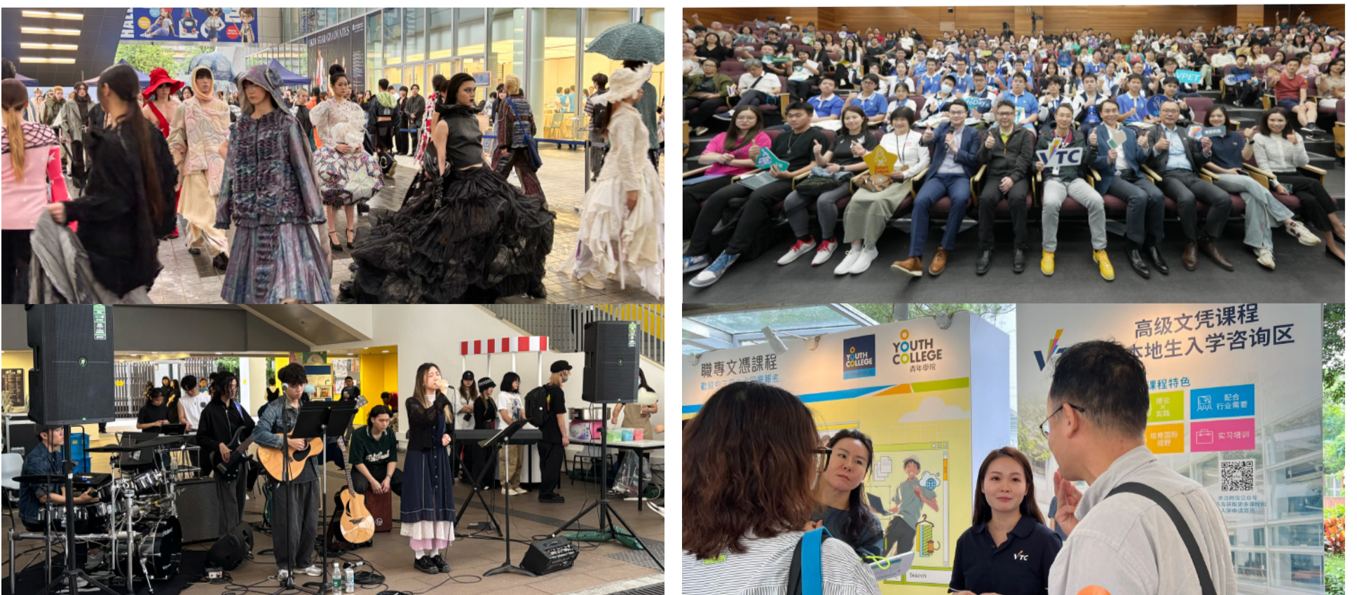
HKDI于资讯日举行迷你时装秀及街头音乐表演, 展示院校学生的才华。