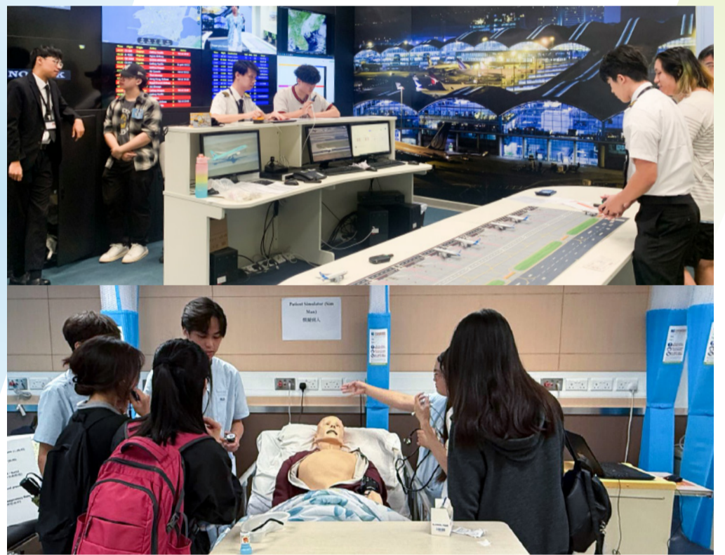
透过参观模拟业界真实运作的培训设施, 加深同学对实际工作环境的理解与认识。

IVE、HKDI、HKIIT, 以及HTI/CCI/ICI的课程资讯及体验日, 安排了一系列活动及工作坊, 让参加者体验各学科的互动教学模式。院校内多个模拟相关工作环境及创新的教学设施, 如元宇宙创新中心、品酒工房、配药培训及药剂服务资源中心、扩增实境及虚拟实境实验室等, 亦开放予参加者参观, 实地了解校园内的专业设备如何协助VTC学生掌握专业技能。现场亦设多场讲座及业界代表分享会, 为学生及家长提供升学资讯以及行业发展趋势。此外, 在THEi高科院的入学资讯日, 各学系亦提供多元化摊位体验活动和课程讲座, 让参加者充分了解THEi高科院创新独特的学士学位课程及校园生活。