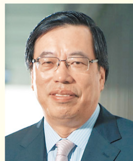
立法會（工業界）議員 梁君彥博士

現任立法會（工業界（第一））議員梁君彥，在紡織界擁有數十年豐富經驗，由他來談論香港工業發展前景，最適合不過。梁君彥指出，凡是涉及行業供應鏈任何一環，或在香港進行生產控制的，都可視為本地工業界一員。目前行業中約有5至6萬間香港廠家於內地設廠，主要負責裝嵌等工序，其餘項目包括營運、設計、營銷、物流等高增長環節，則於香港本土運行。他認為在大勢所趨下，香港工業必須朝「高知識、高科技、高設計」方向發展，走高增值路線。