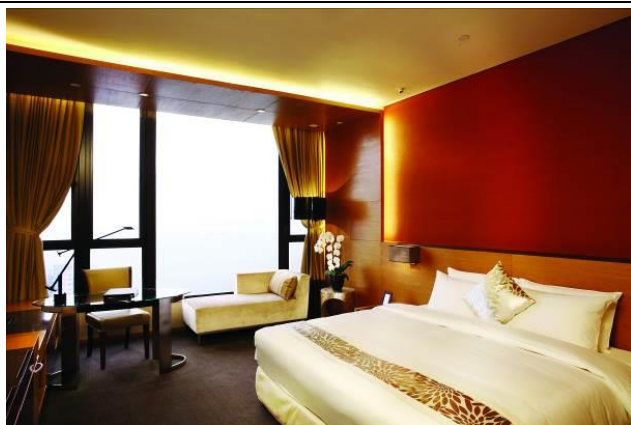
T 酒店客房環境舒適，景觀優美